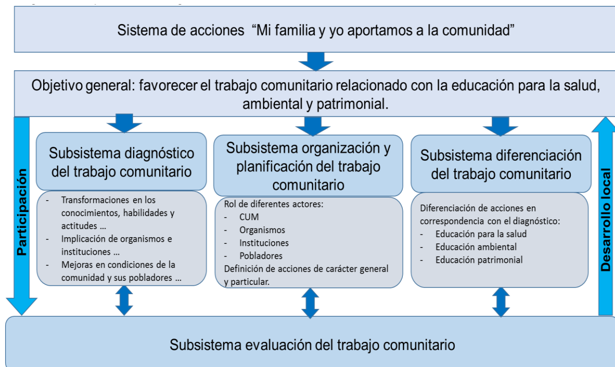
Figura 3 - Representación de los sistemas de acciones de proyecto Mi familia y yo aportamos a la comunidad.

El sistema de acciones Mi familia y yo aportamos a la comunidad, responde a la demanda de contribuir a la transformación de los modos de actuación de los pobladores de los CP del municipio para la preservación de sus patrimonios. Así como para la prevención, mitigación y/o solución de problemáticas ambientales complejas, en un escenario actual en el que se incrementa su vulnerabilidad ante los efectos del cambio climático como principal problema ambiental del siglo XXI. En este contexto se inserta el sistema, que se presenta caracterizado por estimular la participación de organismos e instituciones que prestan servicios a la población, con la guía metodológica y científica del CUM, en función del fortalecimiento del trabajo comunitario relacionado con la educación para la salud, ambiental y patrimonial. En correspondencia con los ODS, los lineamientos de la política económica y social del Partido y el Estado, el Programa de Desarrollo hasta 2030, la Estrategia Ambiental Nacional (2017-2020) y el Plan de Estado para el enfrentamiento al cambio climático “Tarea Vida”. La Figura 3, trae la representación gráfica detallada del sistema de acciones.