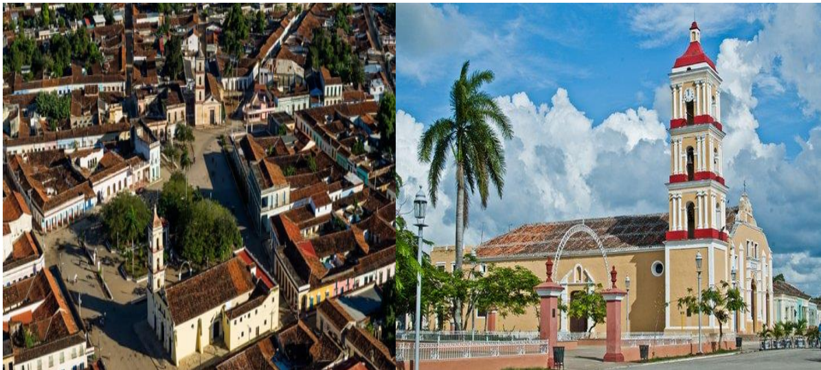
Figura 1 - Plaza central de Remedios y sus iglesias

Ciudad dinámica con excelentes edificios, paseos, parques, escuelas y monumentos donde viven aproximadamente 20 mil habitantes. Posee, flanqueada por hermosos flamboyanes, una plaza muy singular, porque es la única del país con dos iglesias: la de Nuestra Señora del Buen Viaje y la Parroquial Mayor de San Juan Bautista, ambas con gran riqueza arquitectónica (GÓMEZ; BASQUEROTE, 2018). Se caracteriza por la irregularidad de sus calles, con grandes aleros que protegen a los caminantes de la intensidad del sol, a la vez que crean un entorno que llama a adentrarse por las arterias de la centenaria urbe. La Figura 1 presenta una vista de la plaza central y sus iglesias en el corazón de la ciudad.