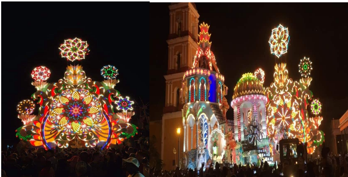
Figura 5- Desfile de las Parrandas.