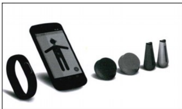
Figura 2 – Pulseiras com funcionalidades para exercícios físicos.

diagnosticar: hipertensão, fibrilação arterial, acidente vascular hemorrágico, apneia do sono, hepatite A, otites, faringite estreptocócica, tuberculose, pneumonia viral aguda, diabetes tipo 2, leucócitos e anemia.