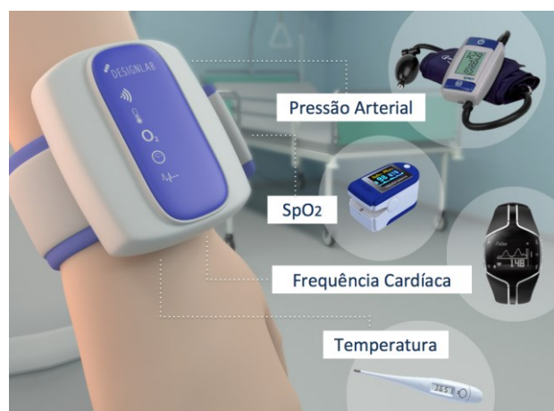
Figura 3 – Modelo conceitual para a Pulseira Multiparamétrica. Fonte: Elaborada pelos próprios autores.

A Pulseira Multiparamétrica consiste em um equipamento que integra diferentes funcionalidades para a realização da coleta de dados dos sinais vitais (ilustrado na figura 3), associada a um software para o gerenciamento dos dados coletados. O protótipo desenvolvido é capaz de aferir a pressão arterial, batimentos, temperatura e respiração do paciente, além de transmitir estes dados em tempo real ao aplicativo.