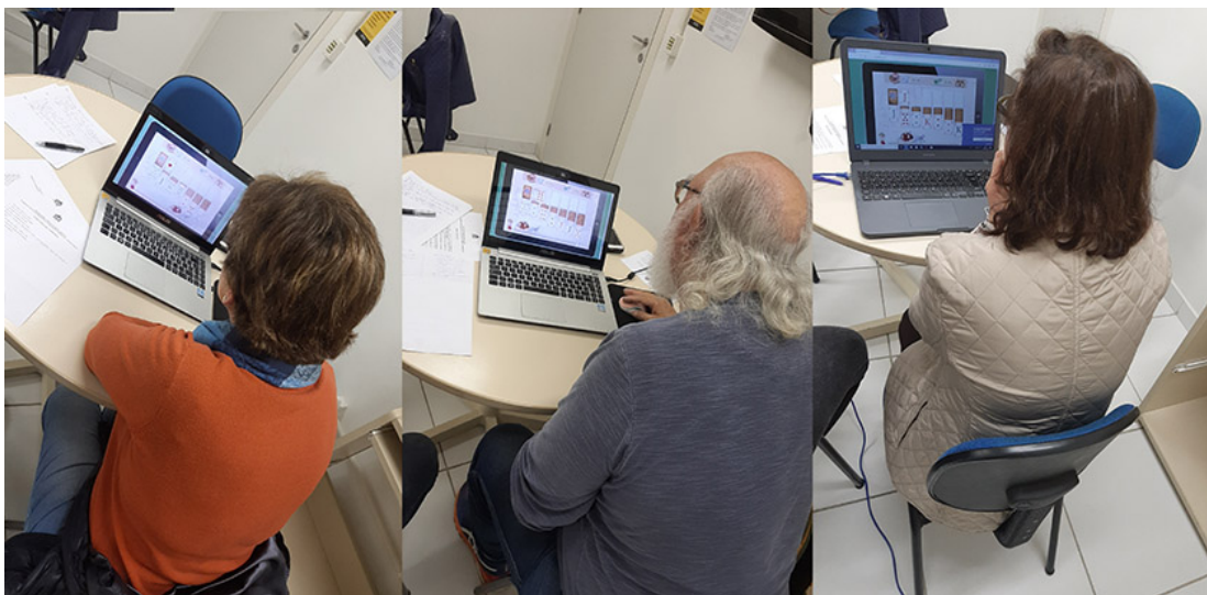
Figura 2 – Participantes jogando SolitaireQuiz .

A Figura 2 mostra alguns dos participantes durante a primeira etapa.