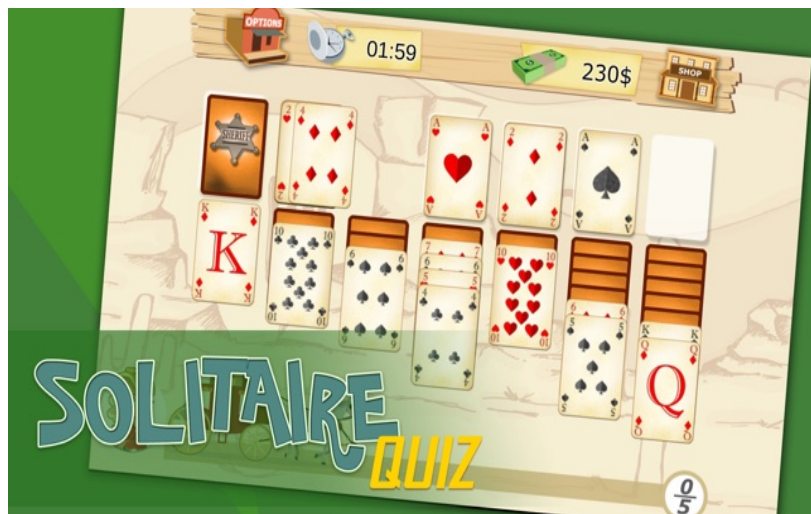
Figura 1 - Tela inicial do jogo.

Neste trabalho o jogo SolitaireQuiz foi escolhido como objeto de estudo. Ele é um jogo digital no estilo paciência, onde o jogador deve formar grupos de cartas ordenados por números e cores, em ordem decrescente e, à medida que o usuário vai acertando a ordenação das cartas, uma pergunta sobre um tema escolhido inicialmente pelo usuário surge na tela. Caso o usuário acerte a pergunta ele recebe dinheiro para comprar itens que podem facilitar suas jogadas na “lojinha” do jogo, caso contrário o usuário perde uma certa quantidade de dinheiro.