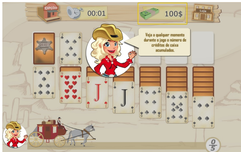
Figura 4 – Item de ajuda na tela do jogo – “Vaqueira”.

Iniciar um jogo, mover as peças utilizando o mouse foi considerado fácil, ou parcialmente fácil pelos idosos que participaram da pesquisa. Não foi observada dificuldade sobre o domínio do mouse para utilização do jogo SolitaireQuiz . Quanto à escolha das cartas e a realização de movimentos com elas durante o jogo, a maioria dos sujeitos, 60%, disse que era fácil fazê-lo. Enquanto os outros 40 por cento ficaram divididos, entre discordar parcialmente da afirmação de que é fácil realizar as tarefas mencionadas e não concordar ou discordar da afirmação. No entanto, quando se considera a questão norteadora cinco – 5. Os sujeitos conseguiram responder as questões em relação ao nível escolhido (fácil, médio, difícil)? – pode-se observar que alguns idosos demonstraram dificuldades em entender a ordem das cartas e o sentido das cores.