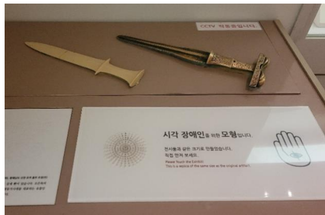
Figura 1 –Objetos disponíveis para o toque, acompanhadas de audiodescrição, no Museu Nacional da Coreia

Apesar de encontrarmos nos estudos a apreciação de pessoas com deficiência visual por conseguirem ter auxílio de seus acompanhantes durante as visitas aos museus, a falta de autonomia é um fator recorrentemente reportado pelos participantes em estudos desenvolvidos no campo (HOLLOWAY et al. , 2019; ARGYROPOULOS; KANARI, 2015). As pessoas com deficiência visual estão interessadas em realizar suas visitas de modo mais autônomo e ter mais controle sobre sua experiência no museu (ASAKAWA et al. , 2018). O desenvolvimento de recursos capazes de possibilitar a utilização do tato e da audição para compreensão, pode permitir que as pessoas com deficiência visual desenvolvam suas explorações de modo autônomo (D'AGNANO et al. , 2015). Em determinadas instituições já estão disponíveis recursos elaborados para ampliar o acesso das pessoas com deficiência, por meio de reproduções dos objetos originais acompanhados de audiodescrição, como é o caso do Museu Nacional da Coreia, em Seul (Figura 1).