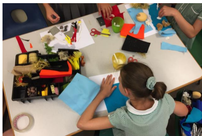
Figura 4: Imagem do estudo de Cullen e Metatla - Co-design com crianças com habilidades visuais mistas utilizando uma caixa de material multissensorial

Cullen e Metatla (2019) projetaram um sistema de mapeamento colaborativo de histórias, em co-design com um grupo de crianças com habilidades visuais mistas e seus educadores e assistentes. A solução produzida estava fortemente centralizada no áudio. Segundo os autores, os participantes demonstraram interesse em efeitos sonoros desde o começo da experiência. Durante a produção, as crianças que participaram do estudo estavam ansiosas para gravar e ouvir suas próprias vozes. Ao utilizarem uma caixa com materiais multissensoriais, as crianças que participavam da atividade também pensaram em adicionar experiências táteis e olfativas ao sistema em desenvolvimento (Figura 4). Os autores afirmam que é importante que grupos com habilidades mistas recebam instruções táteis e multissensoriais para promover discussões colaborativas e a geração de ideias. Como mais um elemento de promoção da multissensorialidade, os autores utilizaram frascos de odores. O uso dessa técnica foi considerado pelos autores um dos aspectos mais envolventes e colaborativos, eles relatam que os participantes gostaram do aspecto tangível e analógico deste compartilhamento.