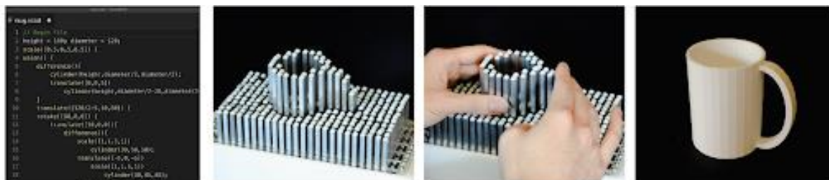
Figura 6 – ShapeCad

Siu e colaboradores (2019) utilizaram a abordagem de design participativo para incluir pessoas com deficiência visual como co-designers. Fundamentados nas descobertas verificadas por meio do processo de co-design, os autores implementaram o shapeCAD. O sistema consiste em um ambiente de programação para modelagem 3D acessível, onde o modelo de saída é renderizado em um display de formato 2.5D (Figura 6). Para interagir com o modelo renderizado são utilizados controles deslizantes, um mouse 3D e um teclado. Os autores desenvolveram sessões de co-design com cada um dos três participantes. Os autores utilizavam as informações coletadas para elaborar e implementar novas interações para as sessões posteriores.