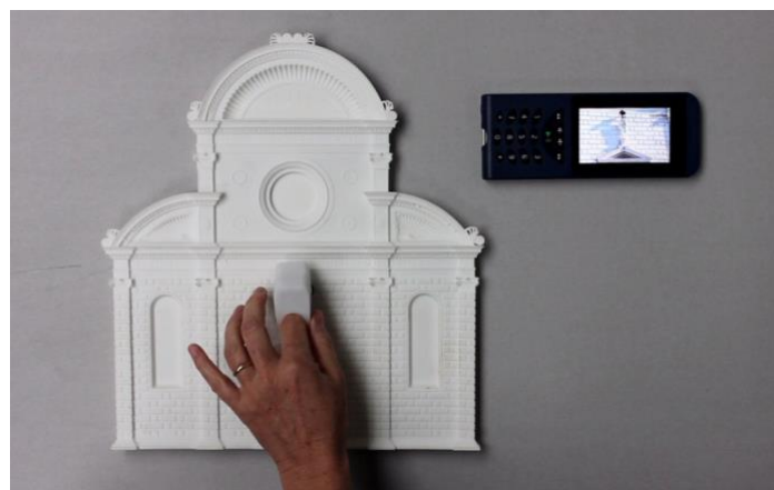
Figura 2 - Sistema composto por anel inteligente “Tooteko”

O estudo elaborado por D’Agnano e colaboradores (2015) é um exemplo das possibilidades de desenvolvimento por meio da utilização das tecnologias 3D alinhadas às demais tecnologias disponíveis. Os pesquisadores desenvolveram um dispositivo - Tooteko - que permite que os usuários obtenham conteúdos de áudios ao navegar com as pontas dos dedos por superfícies tridimensionais. Elaborado para tornar a arte mais acessível às pessoas com deficiência visual, o sistema composto por meio de um anel inteligente, uma superfície tátil impressa tridimensionalmente (contendo sensores de proximidade) e um aplicativo, detecta e realiza a leitura das etiquetas presentes em reproduções impressas, sem a utilização de fios (Figura 2). No estudo, para produção das superfícies táteis, foi utilizada a digitalização 3D por meio do escaneamento a laser e da fotogrametria.