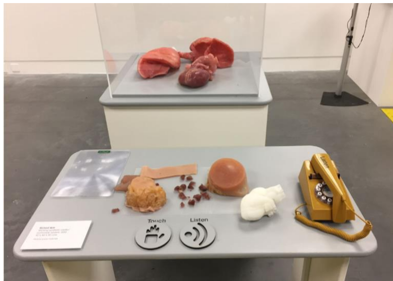
Figura 5 - Mesa multissensorial elaborada no estudo de Chick (2018)

O estudo de Chick (2018) relata o desenvolvimento, por meio da coprodução, de uma exposição inclusiva temporária. Um grupo foi criado incluindo cinco participantes com deficiência visual e seus acompanhantes. Foram utilizadas técnicas como observação participante, entrevistas semiestruturadas e sessões de cocriação e coavaliação. Nas sessões de cocriação os participantes buscaram solucionar o questionamento central de como projetar e organizar uma exposição não permanente priorizando o acesso intelectual aos visitantes cegos e com visão parcial. O grupo considerou importante disponibilizar objetos em 3D impressos com materiais, formas e texturas diversas. Co-avaliaram a exposição dois participantes das sessões de cocriação e mais dois usuários convidados com perda de visão. O envolvimento de pessoas com deficiência visual e a natureza colaborativa da pesquisa permitiram o aprimoramento de orientações inclusivas existentes e a elaboração de novas soluções de acesso aprimoradas aos visitantes com deficiência visual. Entre as diversas soluções elaboradas pode-se destacar as mesas multissensoriais (Figura 7), os caminhos demarcados no piso até às mesas e os materiais disponíveis para o toque. Para a autora, as sessões de cocriação com usuários com deficiência visual precisam ser cuidadosamente planejadas, com a seleção de uma sala adequada, com boas instalações e iluminação além do fornecimento antecipado de materiais.