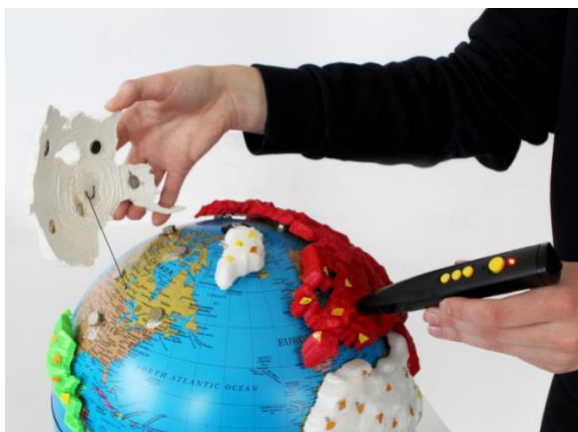
Figura 5 – Globo desenvolvido em projeto participativo

Ghodke e colaboradores (2019) desenvolveram um globo áudio-tátil 3D (Figura 5) em um processo de design participativo incluindo pessoas com deficiência visual. Inicialmente, foi realizada uma entrevista e observação com um participante com deficiência visual, que havia elaborado seu próprio globo adaptado. Além da entrevista também foram desenvolvidas três sessões de design participativo com este participante. Por meio da realização dessas sessões foram planejados e prototipados novos recursos para o globo até a confecção de um terceiro protótipo, que foi apresentado para mais quatro participantes com deficiência visual em uma sessão de avaliação. A sessão de avaliação também incluiu o participante das sessões iniciais. Os insights obtidos por meio desta avaliação foram utilizados para o desenvolvimento de uma última versão. As sessões de design participativo e avaliação foram gravadas em vídeo para que os autores pudessem observar as interações. O globo desenvolvido permite a compreensão de características espaciais como formas de relevo, elevações, topografia, dimensões relativas, bem como os nomes dos países e continentes. Para os autores a experiência pessoal prévia do primeiro participante, obtida com o desenvolvimento de seu globo, impactou positivamente as sessões. Bem como, a inclusão de diversas perspectivas durante o design participativo, que impulsionou a evolução dos protótipos.