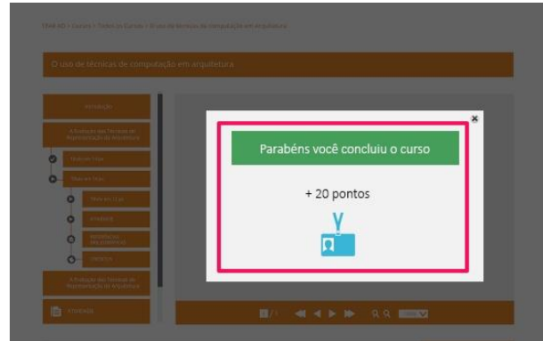
Figura 3 - Interface TEAR_AD com elementos gamificados

O Ranking (E) é uma lista das melhores pontuações no sistema. No quadro é destacado o “Líder” com a maior pontuação, seguindo do 2º ao 10º Colocado. O último elemento gamificado inserido ao perfil do jogador (Figura 5) é a Integração (F) , que é a ação de trazer um novo jogador ao sistema. No protótipo foi inserido o plugin da rede social Facebook, com um botão de convidar amigos, que possibilitará selecionar os amigos do jogador da sua rede social e chamar para conhecer o TEAR_AD.