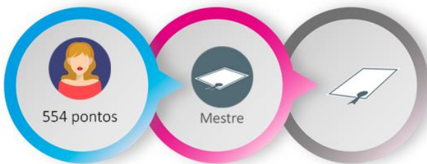
Figura 2 – Visualização do processo Pontos, Nível e Recompensas

A Recompensa (C) recebida pelo jogador são troféus do nível conquistado. Zichermann e Cunningham (2011) afirmam que as recompensas são excelentes na forma de incentivo. Na tela projetada para o sistema (Figura 5), recompensas, pontos e níveis estão relacionados. Pois, quando o jogador conquista determinado número de pontos, passa a pertencer ao nível correspondente (Ver figura 9), cada Nível (D) tem seu nome e um troféu ( badge ). Na figura 6 ilustra-se esse processo.