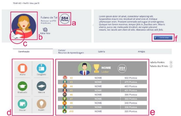
Figura 1 - Interface TEAR_AD com elementos gamificados

A Recompensa (C) recebida pelo jogador são troféus do nível conquistado. Zichermann e Cunningham (2011) afirmam que as recompensas são excelentes na forma de incentivo. Na tela projetada para o sistema (Figura 5), recompensas, pontos e níveis estão relacionados. Pois, quando o jogador conquista determinado número de pontos, passa a pertencer ao nível correspondente (Ver figura 9), cada Nível (D) tem seu nome e um troféu ( badge ). Na figura 6 ilustra-se esse processo.