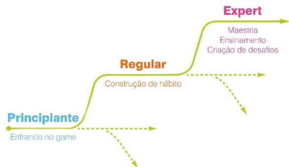
Figura 3 – Ciclo de Vida do jogador

Isso significa que é preciso planejar um roteiro de gamificação, além de considerar o nível de habilidade dos jogadores para sustentar seu envolvimento e prazer (KUMAR; HERGER, 2013).