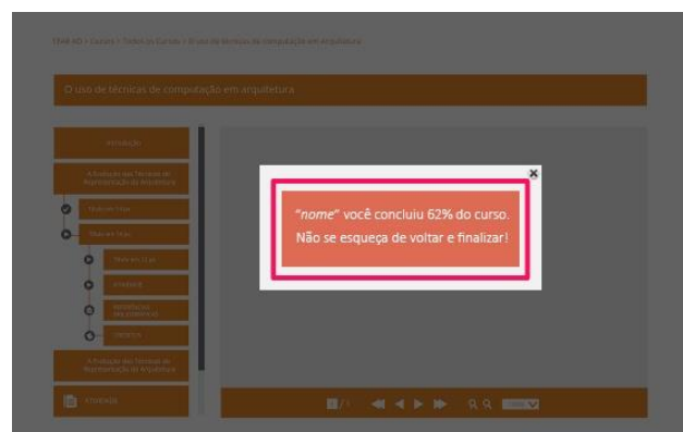
Figura 4 – Interface TEAR_AD com elementos gamificados

No TEAR_AD haverá também outras formas de inclusão do feedback: mensagens de alerta ao jogador (Figura 8), mensagens positivas e também mensagens negativas.