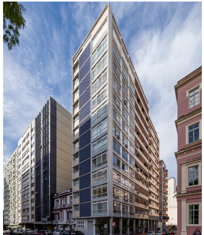
Figura 05: Edifício Faial – projeto do arquiteto Emil A. Bered, de 1962, na cidade de Porto Alegre, RS – Fotografia obtida com uma lente (objetiva) Tilt&Shift, com distância focal de 17 mm “super grande angular”.

Com tudo que foi demonstrado anteriormente, parece ser parte importante do enunciado, ou função, da fotografia nos dias atuais: representar um universo idealizado que de certa maneira existe, inicialmente, apenas na imaginação do fotógrafo/operador, não havendo mais foco na representação de uma cena “real”, como se espera de uma ferramenta de representação em arquitetura. No momento que se entende que a fotografia é muito mais expressão do que representação – “fotografia-segundo-o-fotógrafo” (BARTHES, 2008, p. 17) – coloca-se em dúvida o seu papel dentro do sistema de representação em arquitetura – ou deve-se olhar para este meio de comunicação de uma maneira mais crítica afim de se perceber suas peculiaridades?